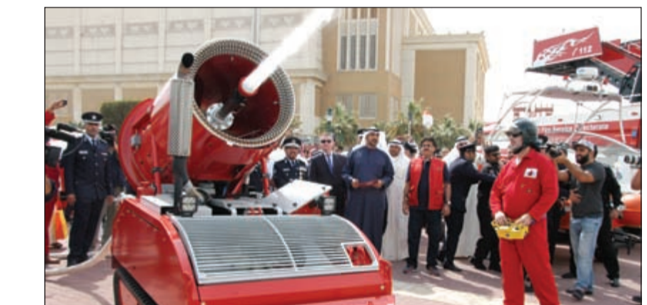
إحدى الآليات الحديثة التي تسلمتها الإدارة العامة للإطفاء