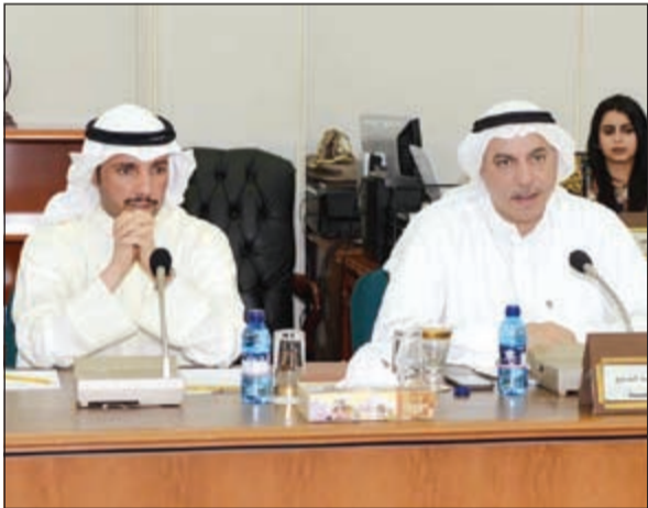
رئيس مجلس الأمة مرزوق الغانم والنائب فيصل الشايح خلال اجتماع اللجنة المالية

أسعار محددة للسكن الخاص والاستثماري والصناعي والزراعي الحكومة اقترحت شرائح للكهرباء والشايح: لن نوافق على ما يضر المواطن