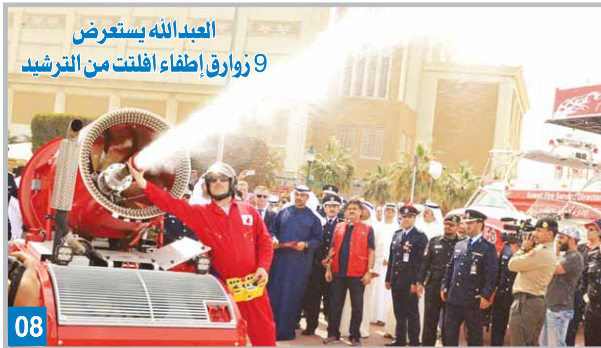
العبدالله يستعرض 9 زوارق إطفاء افلقت من الترشيح