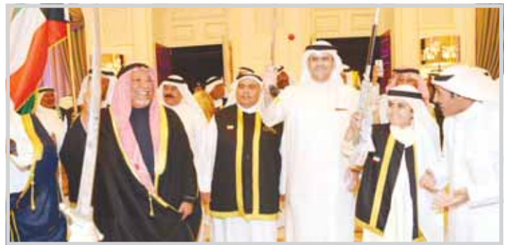
الديوان الأميري افتتح صالة الشيخ أحمد أحمد صباح الأحمد في الجهراء

■ وصف نائب رئيس الشرطة والأمن العام في دبي الفريق ضاحي خلفان "حزب الله" اللبناني بأنه "خنجر في صدر الأمة العربية"، وذلك غداة تصفيته من دول مجلس التعاون الخليجي "منظمة إرهابية"، ووصفه من قبل وزراء الداخلية العرب بـ"الإرهابي". واعتبر خلفان، في سلسلة تغريدات عبر حسابه على موقع "تويتر"، أن الحصار ضد من وصفه بـ"حزب اللات" هو "أولى الخطوات الصحيحة"، مضيفاً إن "حزب اللات خارج الأمة العربية"، و"في الصراع العربي-الفرنسي-العربي حزب اللات خنجر في صدر الأمة العربية". ورأى أن "حزب الإرهاب قتل بقيادة نصر اللات من السوريين في 3 سنوات مالم