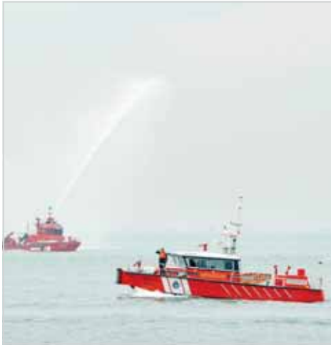
أحد الزوارق الجديدة