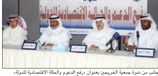
جانب من ندوة جمعية الخريجين بعنوان «رفع الدعم والحالة الاقتصادية للدولة»

ندوة «الخريجين»: اختلافات الميزانية تحتاج حلولاً جذرية بعيداً عن جيوب المواطنين