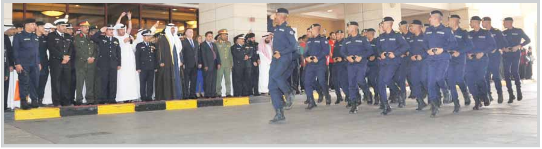
جانب من عرض عسكري لرجال الإطفاء

رعى الاحتفال بيوم رجل الإطفاء الرابع عشر بسوق شرق