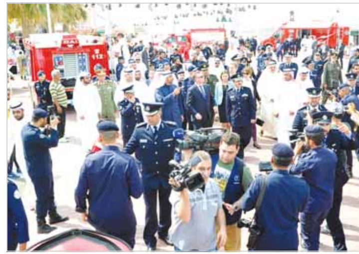
جولة في معرض معدات الإطفاء

توعوية وتعليمية لشتى القطاعات، وفتح مراكز الإطفاء لتوعية الأطفال من قبل أخصائيين إجتماعيين. بحضوره قال مدير إدارة الملائك العامة في الإدارة العامة للإطفاء