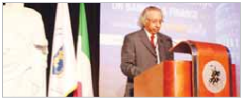
■ الشيخ محمد الجراح متحدثاً في القمة

■ أكد رئيس مجلس إدارة اتحاد المصارف العربية، رئيس مجلس إدارة بنك الكويت الدولي الشيخ محمد الجراح الصباح على أهمية المواضيع والقضايا التي ناقشتها القمة المصرفية العربية الدولية لعام 2016 في العاصمة الإيطالية "روما"، تحت رعاية دولة رئيس مجلس الوزراء الإيطالي / ماجور ريزي وركزت في مجملها على "أثر التغير المناخي على الصيرفة والخدمات المالية" وذلك بحضور ومشاركة أكثر من 300 شخصية قيادية وفخيرة مالي ومصرفي يمثلون مختلف المؤسسات المالية والمصرفية والبنوك وشركات التأمين في القطاعين الحكومي والخاص حول العالم، يتقدمهم محافظو البنوك المركزية، مضمين بخلفية من المستثمرين ورجال الأعمال المعنيين في مجال الطاقة والتعميل والتكنولوجيا وما على شكلتها من القضاة الحيوية الأخرى.