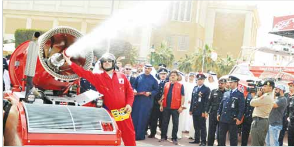
الشيخ محمد العبدالله يطلع على إحدى المعدات الجديدة